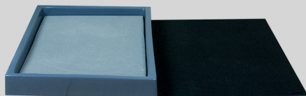
MODELO DE UNA BANDEJA